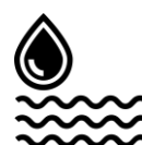
Fleuves et rivières